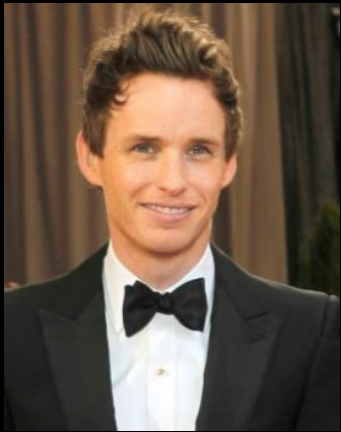
艾迪·瑞德曼 Eddie Redmayne 2015年奧斯卡影帝